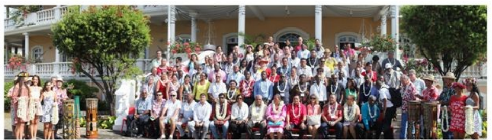
HOTEL DE VILLE DE PAPEETE 20/11/14

Le congrès 2014 s'est tenu en Polynésie française du 16 au 20 novembre. Des intervenants de qualité, des interventions intéressantes, des visites de terrain formatrices, un accueil chaleureux et la découverte de quelques aspects de la culture polynésienne et marquisienne. Les congressistes étaient enthousiastes à la clôture des travaux à l'hôtel de ville de Papeete. Le développement durable a tenu une place importante avec la présentation de l'hôtel Le Brando, les agendas 21 et la transition énergétique, les aires marines protégées et le PGEM de Moorea. Une après-midi consacrée aux finances, fiscalité locale et fonds européens, une journée sur l'eau potable et l'assainissement. L'intercommunalité a également fait l'objet d'un atelier.