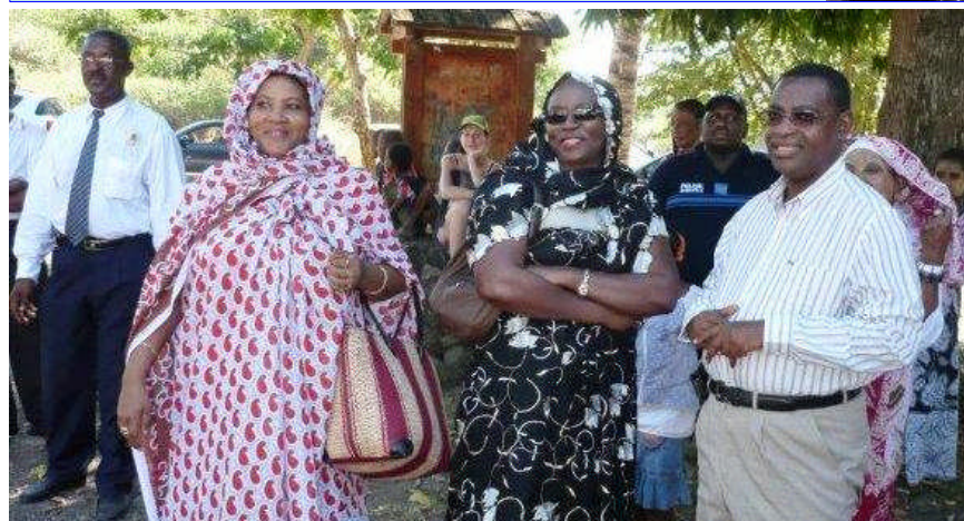
La Secrétaire Générale, le Maire de Pamandzi et celui de Mamoudzou