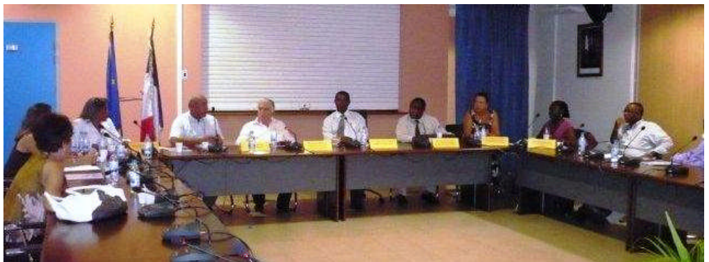
Les membres du bureau dans la salle du Conseil municipal de Mamoudzou

La prochaine réunion du conseil d'administration est programmée les 4, 5 et 7 juillet à Paris avec deux journées de formation sur les Agendas 21. Les élus non administrateurs intéressés par ces journées de formation pourront s'inscrire dans la limite des places disponibles. Se renseigner auprès du secrétariat.