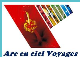
Arc en Ciel Voyages

ARC EN CIEL VOYAGES 59, Avenue du Maréchal Foch BP 1244 – NOUMEA NOUVELLE CALEDONIE Tél +687 27 19 80 – Fax +687 27 62 77